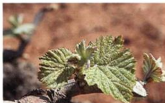
Hojas extendidas (Estado E)