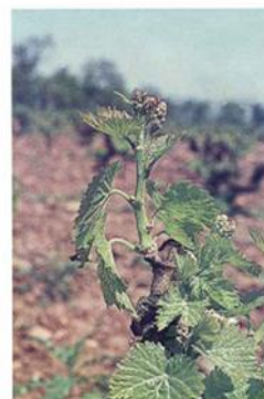
Racimos visibles (Estado F)