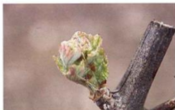
Hojas incipientes (Estado D)