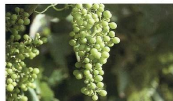
Cerramiento del racimo (Estado L)

Nota abreviaturas fenología: At -estado más atrasado, Fr -estado más frecuente, Av -estado más avanzado