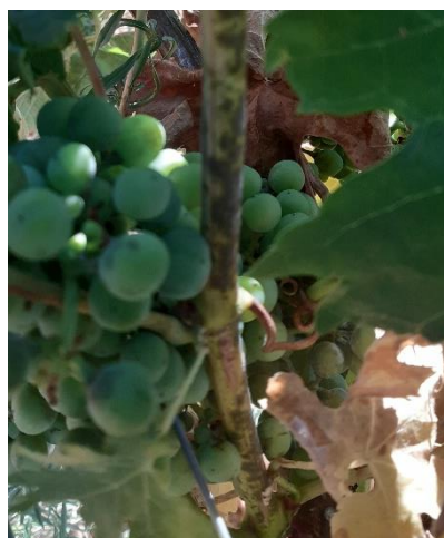
o en pámpano, hojas y racimo.

Las materias activas recomendadas son varias, bien penetrantes o de contacto, (triazoles, estrobilurinas, azufre, ...) y se pueden consultar en la página web el Boletín de Avisos Fitosanitarios de la Rioja nº8 https://www.larioja.org/agricultura/es/publicaciones/boletin-avisos-fitosanitarios-2024