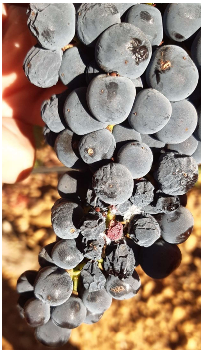
Foto: foco polilla del racimo sobre variedad tinta.