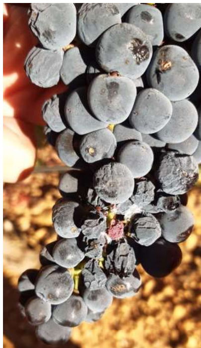
Foto: foco polilla del racimo sobre variedad tinta.