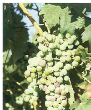
Inicio de envero (5% de granos enverados) (Estado M 1 )

Nota abreviaturas fenología: At -estado más atrasado, Fr -estado más frecuente, Av -estado más avanzado.